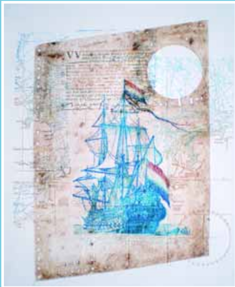
LEENTJE LINDERS etsen