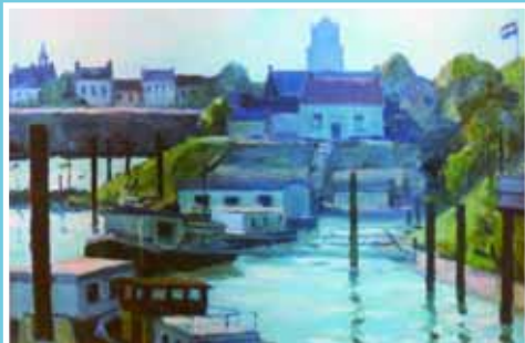
HARRY VAN DER WOERD olieverfschilderijen