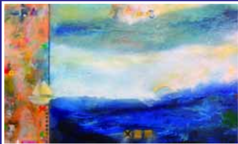
THEO KOSTER schilderijen