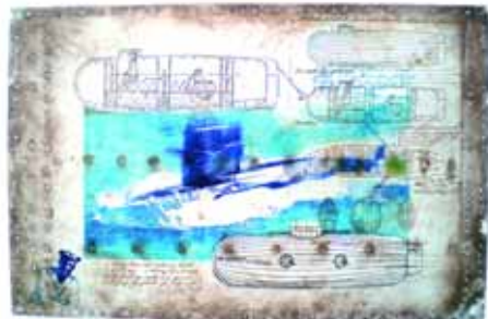
LEENTJE LINDERS etsen

EXPOSITIE 14 JUNI - 14 JULI 2012 SCHEPEN EN WATER