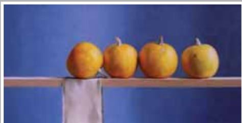
NATASCHA VAN DEN BERG