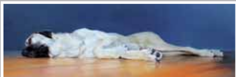
LOTHAR bronzen fruit